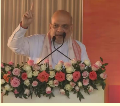
ప్రచార సభలో అమిత్ షా మాట్లాడుతూ, తిరిగి తాము అధికారంలోకి వస్తే అత్రమ చొరబాటు విషయంలో కఠినంగా వ్యవహరిస్తామని చెప్పారు. గిరిజనాభివృద్ధికి ప్రధాన మంత్రి నరేంద్ర మోదీ, అసోం ముఖ్యమంత్రి హిమంత బిశ్మిల్...

వారు ఇక్కడ నాలుగేసి పెళ్లెళ్లు చేసుకోకుండా అడ్డుకట్ట అసోం ఎన్నికల ప్రచారంలో అమిత్ షా