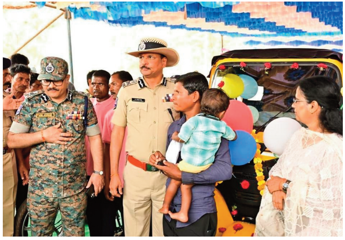
సౌకర్యం మెరుగుపడింది. అత్యవసర సమయాల్లో ఆసుపత్రికి వెళ్లడానికి గ్రామస్థుల కోసం ప్రభుత్వం ఒక ఆటో, టూ వీల్ లను కమ్యూనిటీ వాహనాలుగా అందజేసింది. గతంలో 12-13 కిలోమీటర్లు కాలినడకన వెళ్లాలి దుస్థితి ఇప్పుడు తొలగిపోయింది. ఇప్పటికీ విద్యుత్ సౌకర్యం లేని మారుమూల ఇళ్లకు సోలార్ కందిళ్లను పంపిణీ చేయడం ద్వారా ప్రభుత్వం చీకట్లను తొలగిస్తోంది. కనీసం ఆధార్ కార్డులు, ఓటూ హక్కు వంటి కనీస గుర్తింపు కూడా లేని ఆదివాసీలకు ఇప్పుడు అన్ని ప్రభుత్వ ఫలాలను అందించడమే లక్ష్యంగా