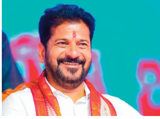
ప్రభుత్వం అంటే తనకు నచ్చదన్నారు. ఊమెన్ చాండీ కరుణాకరన్ ఆధ్వర్యంలో కేరళ అభివృద్ధి చెందిందన్నారు.

మధ్య ఒప్పందం ఉంది. కేసుల నుంచి మోడీ ఆయనను రక్షిస్తున్నారు. రాష్ట్రంలో యువతను విజయన్ మోసం చేస్తున్నారు. కేరళ ప్రజల నుంచి నాకు ఫీడ్ బ్యాక్ వచ్చింది. విజయన్ కు కేసీఆర్ మంచి మిత్రుడు. కేసీఆర్ పాలన గురించి విజయన్ ప్రస్తావించారని రేవంత్ అన్నారు. కేరళం యువత హార్ట్ వర్కింగ్ పీపుల్ అని సీఎం రేవంత్ రెడ్డి కొనియాడారు. తాజాగా కేరళం ఎన్నికల ప్రచారంలో పాల్గొన్న సీఎం రేవంత్ అక్కడి ప్రభుత్వంపై విమర్శలు గుప్పించారు. గల్ఫ్ దేశాల అభివృద్ధిలో కేరళం యువత పాత్ర కీలకమన్నారు. కేరళంలోనే విషాద స్థానాలకు యునైటెడ్ డెమోక్రటిక్ ఫ్రంట్ ప్రభుత్వం చరమాంకం పలుకుందన్నారు. యూడిఎఫ్ గవర్నమెంట్ వస్తుందని ధీమా వ్యక్తం చేశారు. విజయన్ అంటే తనకు గౌరవమని.. కానీ ఆయన