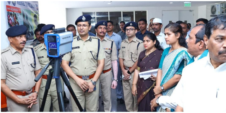
ప్రజా దివాన్ ఉమ్మడి వరంగల్ జిల్లా బ్యూరో ఏప్రిల్ 13:

రాష్ట్ర ప్రభుత్వం ప్రతిష్ఠాత్మకంగా చేపట్టిన 'ప్రజాపాలన--ప్రగతి ప్రణాళిక' 99 రోజుల కార్యచరణలో భాగంగా వరంగల్ పోలీస్ కమిషనరేట్ కీలక ముందగు వేసింది. రహదారి ప్రమాదాల నియంత్రణ ధ్యేయంగా ఈ నెల 13 నుండి 18వ తేదీ వరకు ఉమ్మడి జిల్లా వ్యాప్తంగా నిర్వహించ తలపెట్టిన "అరైవ్ అలైవ్" రోడ్డు భద్రత అవగాహన కార్యక్రమాలు సోమవారం ఘనంగా ప్రారంభమయ్యాయి. జ్యోతి ప్రజ్ఞలనతో శ్రీకారంపాసుకొండలోని కాళోజీ