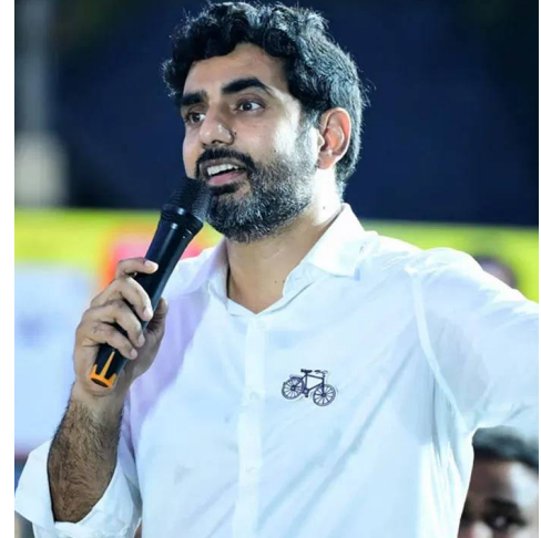
టిడిపి కీలక నిర్ణయం తీసుకుంది. పార్టీ కార్యనిర్వాహక