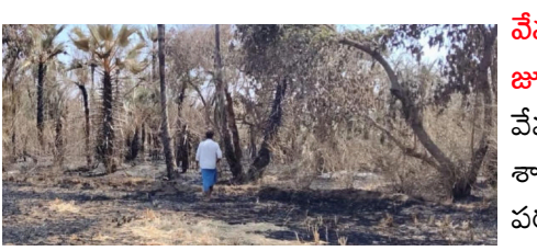
వేములవాడ / ప్రజాదివాస్ జూన్ 03 వేములవాడ మున్సిపల్ శాత్రాజాపల్లి పరిధిలోని పరంపాగు ప్రాంతంలో జరిగిన అగ్నిప్రమాదంలో