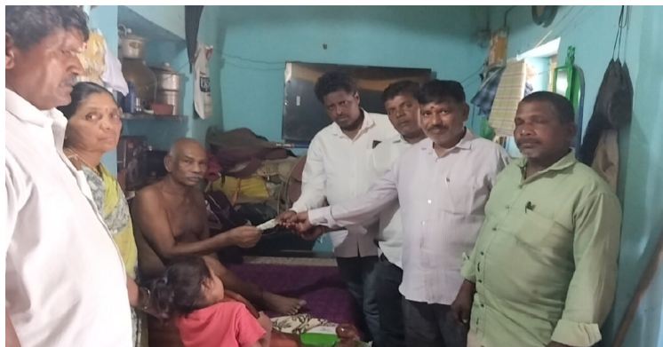
ముస్సాబాద్/జూన్ ప్రజా దివాన్